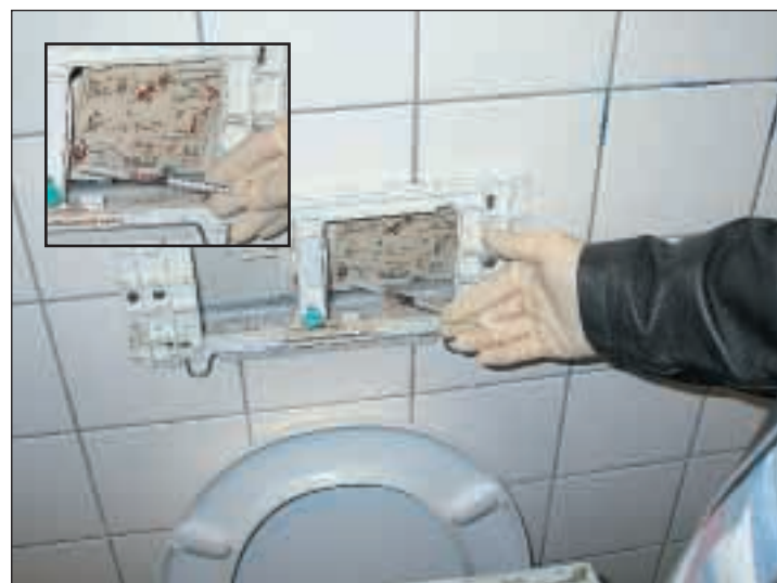
Auf dem WC finden die Ermittler eine Drogenspritze.

Mann in Ruhe. Mit wirrem Blick dreht sich der Kontrollierte von den Gendarmen ab, trinkt sein Bier aus. Er macht kein Geheimnis daraus, dass er seit Jahren schwer drogenabhängig ist. „Was soll's“, meint er nur.