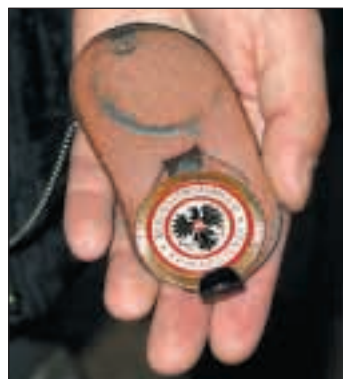
Die Dienstmarke des KKD.

Ruhig und gelassen sprechen die Kriminalisten die Personen an. Diese kennen das Spiel. „Ich hab nix dabei“, sagt ein etwa 25-jähriger Mann mit langen Haaren. Tatsächlich. Die Kriminalisten finden nichts, lassen den