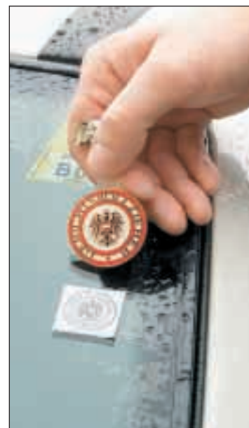
Auch Autos sind ein beliebtes Pfändungsobjekt.